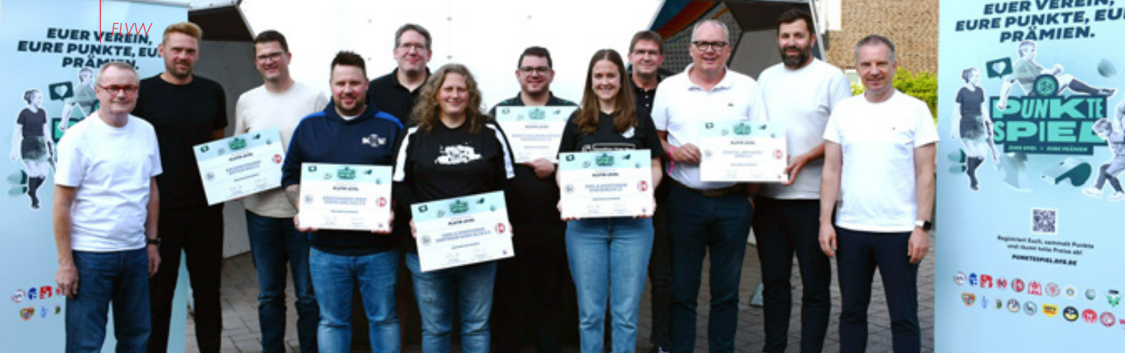
Ein Abend voller Geschichten und Best-Practice-Beispiele gab es im SportCentrum Kaiserau bei der Auszeichnung der Platin-Vereine