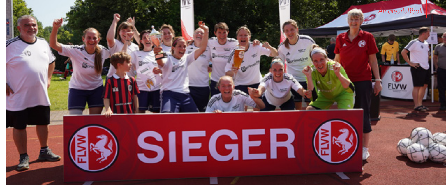
Die Frauen von Olympique Minden siegten ebenfalls vom Punkt

Für die Ü40- und Ü60-Herren und auch für die Ü32-Frauen gab es neben dem Pokal und Siegerurkunden ein prall gefülltes Ballnetz und Biergutscheine von der Krombacher Brauerei.