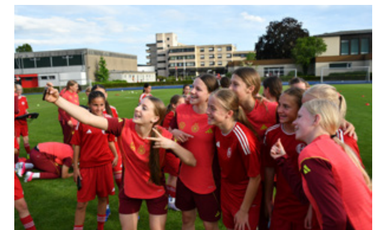
Zum Abschluss war Zeit für Selfies und Autogramme