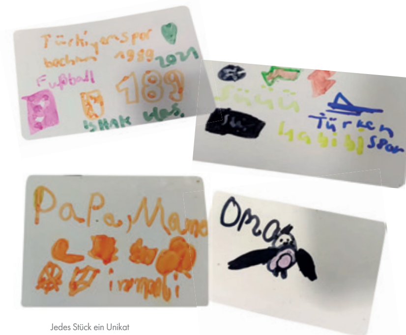
Jedes Stück ein Unikat