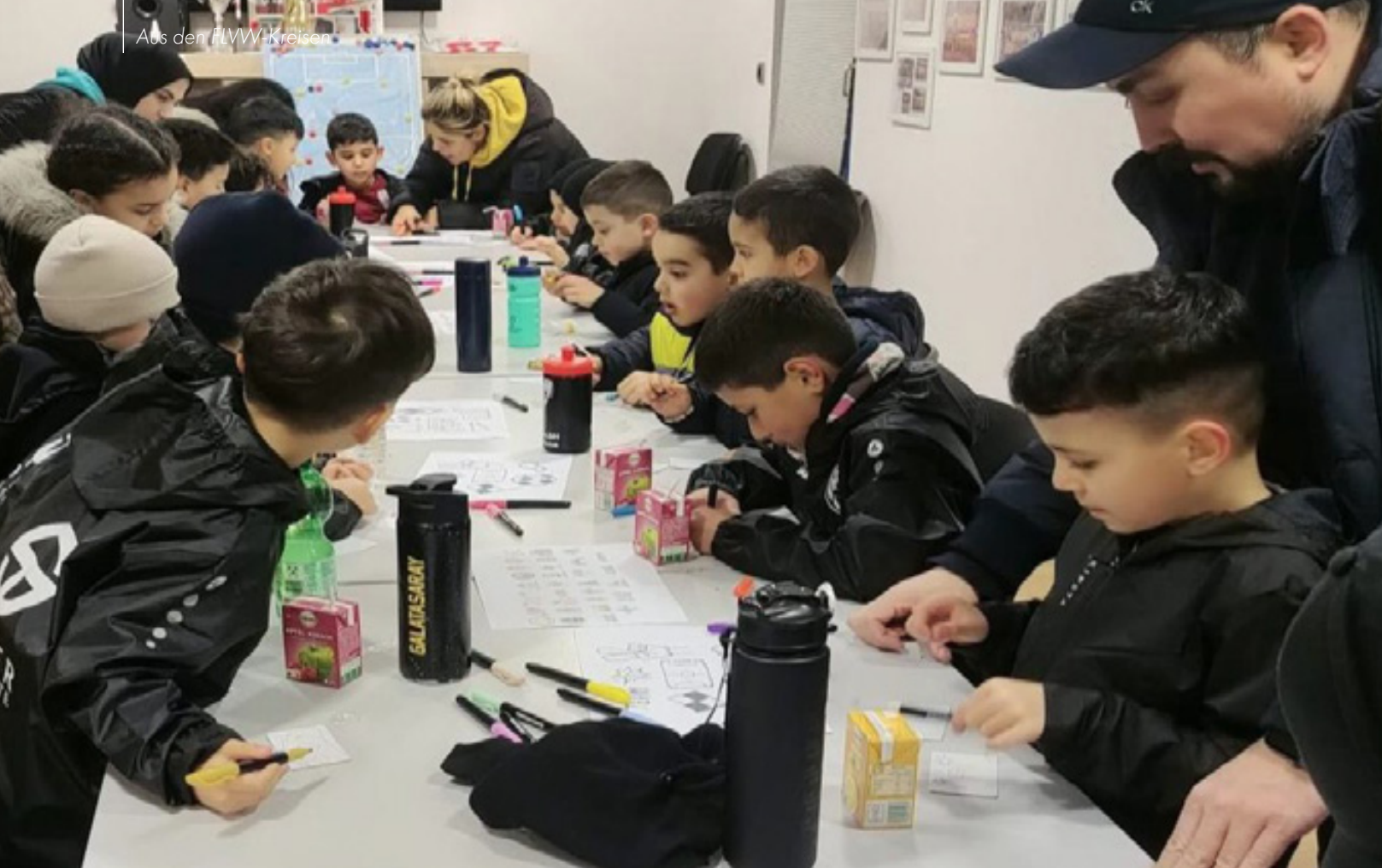
Die Kinder haben mit Feuertifern gemalt und gebastelt