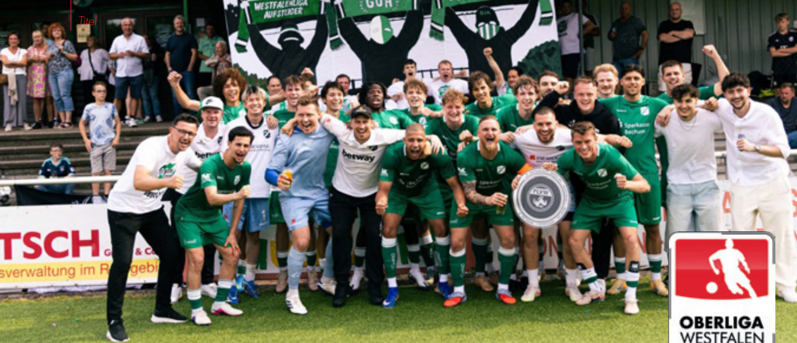
Party pur gabs nach dem Aufstieg an der Hordeler Heide