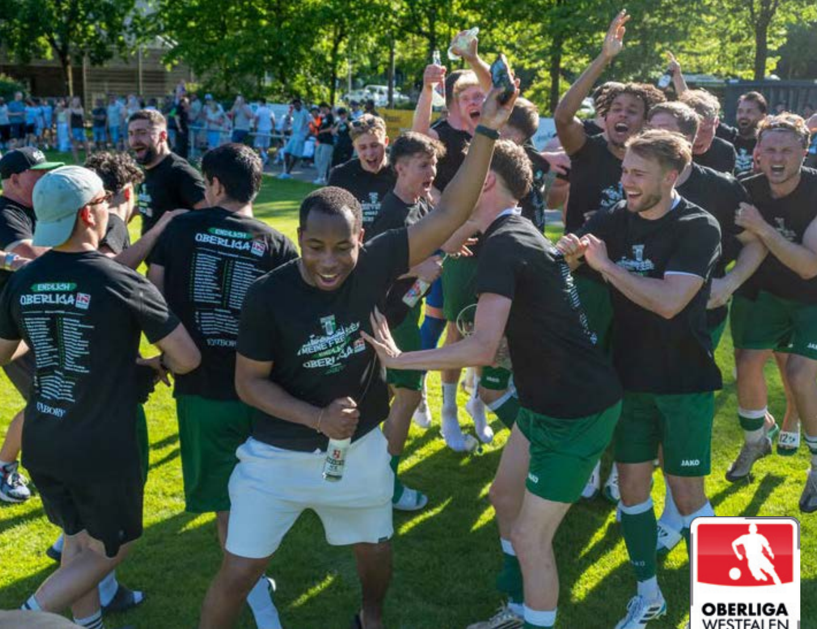
Totale Ekstase herrschte in Kinderhaus nach dem späten Ausgleich