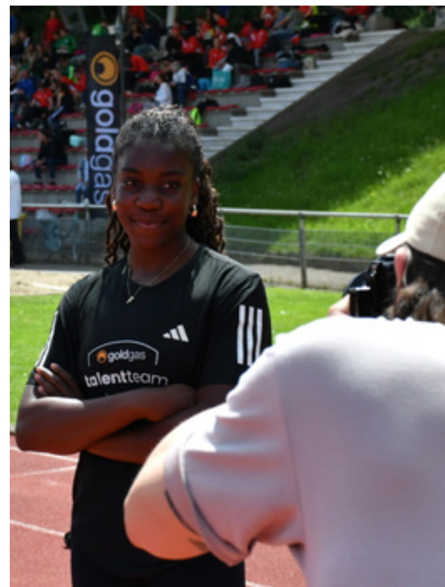
... und wurde den ganzen Tag von Kameras begleitet