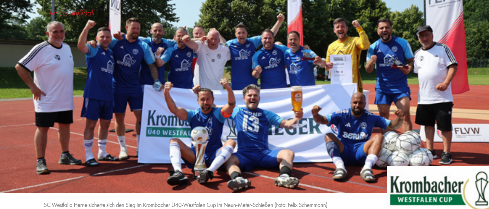
SC Westfalia Herne sicherte sich den Sieg im Krombacher Ü40-Westfalen Cup im Neun-Meter-Schießen