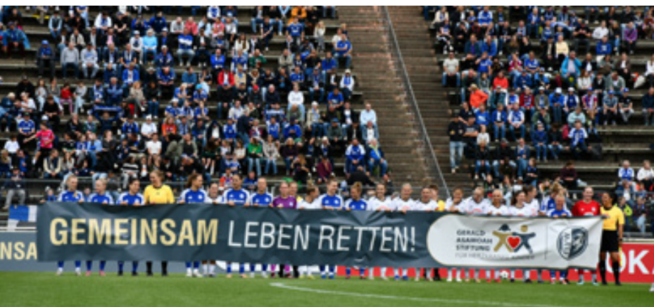
Die Gerald Asamoah Stiftung für herzkranken Kinder war offizieller Partner des Frauen-Westfalenpokals