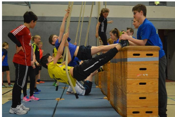
„Auf den Kasten klettern“ (Erfassung Kraft-Last- Verhältnisse)

Disziplinbeispiele des Unterstufenwettkampfs: