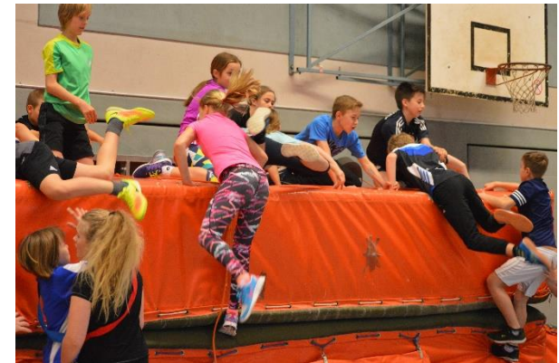
„Auf den Turm“ (Erfassung von Sprungkraft, Armkraft und Kooperationsfähigkeit)