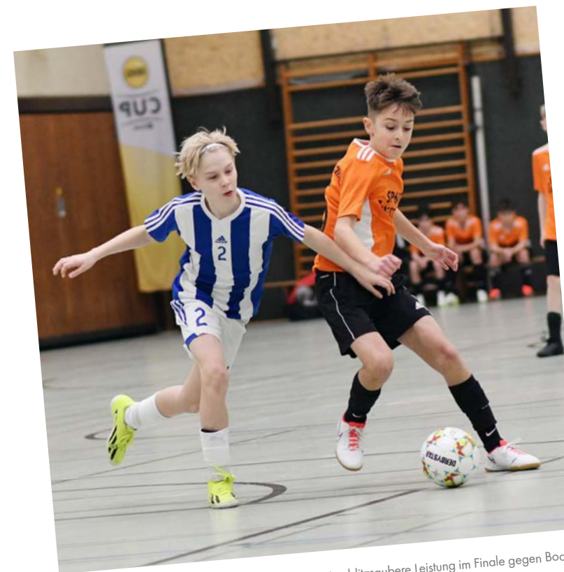
Der Nachwuchs aus dem Märkischen Kreis zeigte eine blitzsaubere Leistung im Finale gegen Bochum