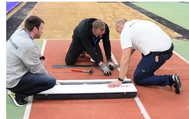
Die Kampfrichter*innen sorgen für optimale Rahmenbedingungen, hier beim Weitsprung