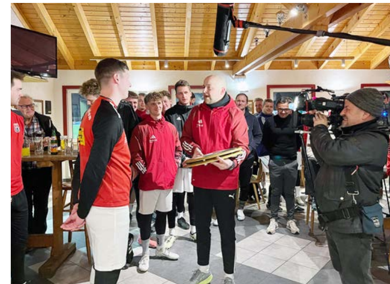
Großer Bahnhof im Vereinsheim bei der Übergabe der Auszeichnung