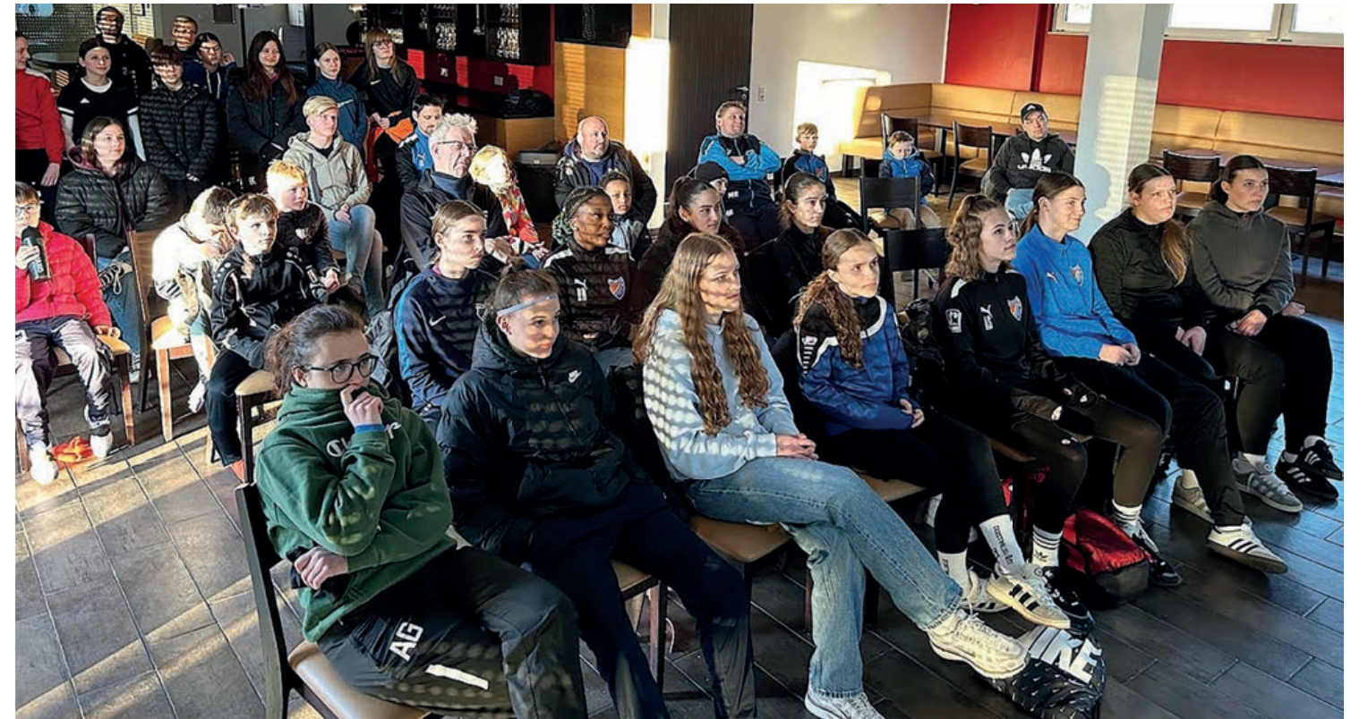
Gespannt hörten die Freudenberger*innen den Nationalspielerinnen zu

Christian Janusch Fotos: SV Fortuna Freudenberg