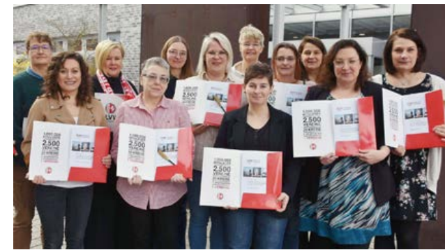
Übergabe der Zertifikate an die erfolgreichen Absolventinnen des 5. FLVW-Leadership-Programms