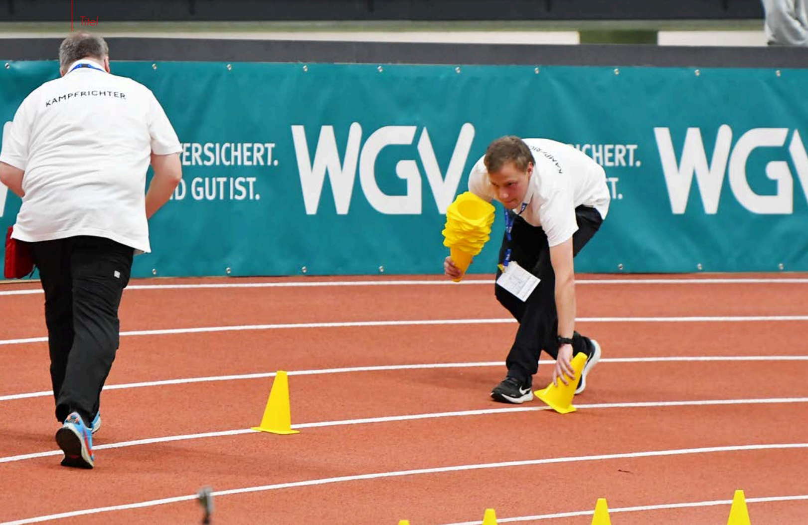
Dank sechs Bahnen, kommt neben Leipzig nur Dortmund als Austragungsort für deutsche Meisterschaften infrage