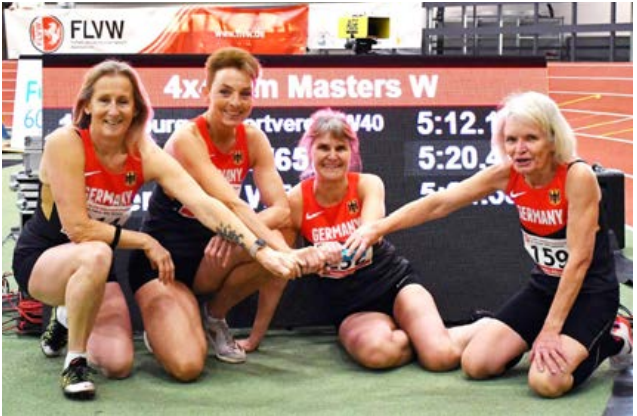
Die schnellsten deutschen Läuferinnen der Klasse W65 erzielten im Rahmen der FLVW-Masters einen Weltrekord in der Staffel.