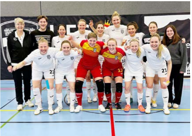
Jubel beim UFC Münster über den vorzeitigen Meistertitel in der Regionalliga West