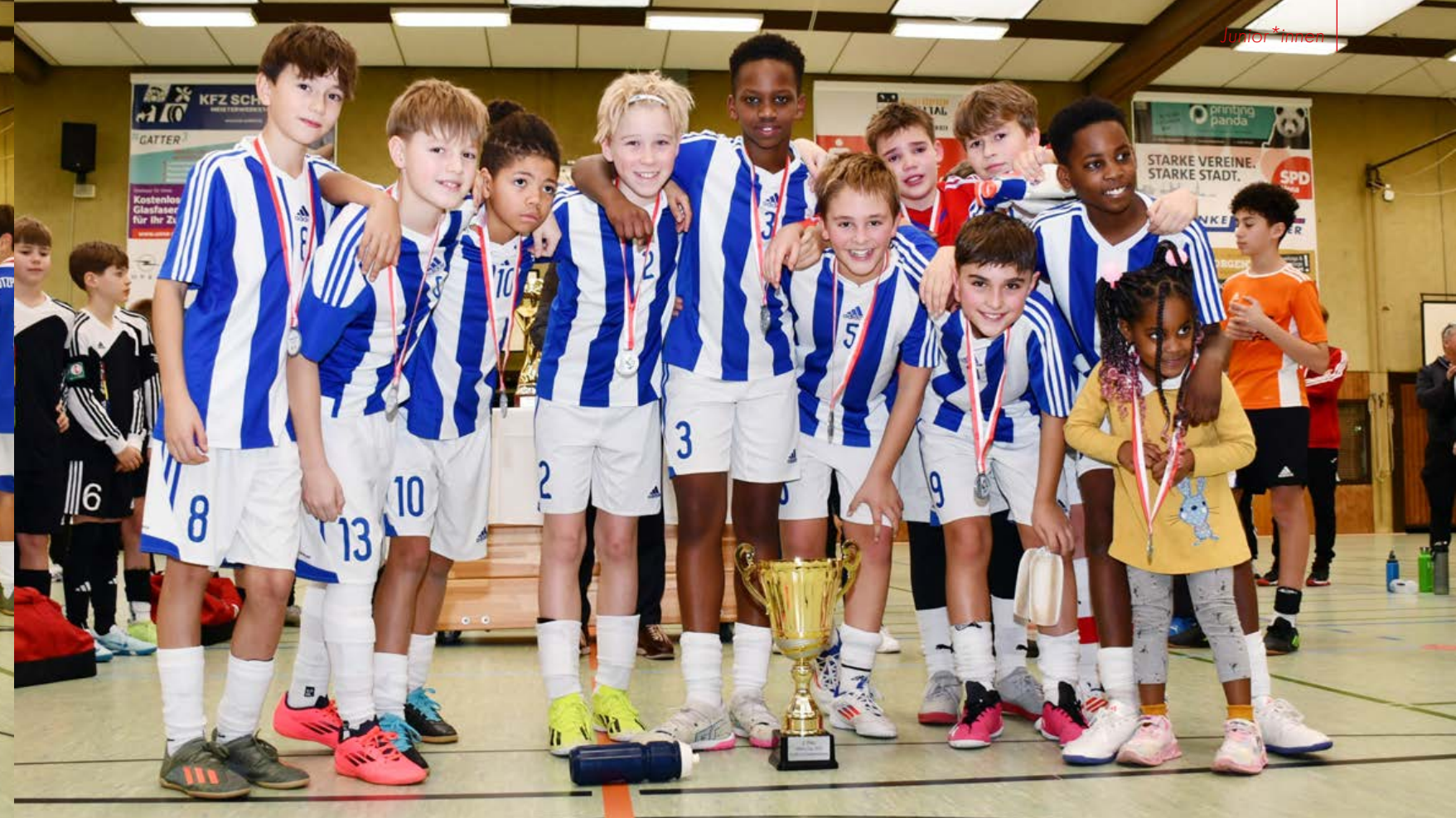
Platz zwei sicherte sich der Stützpunkt Bochum