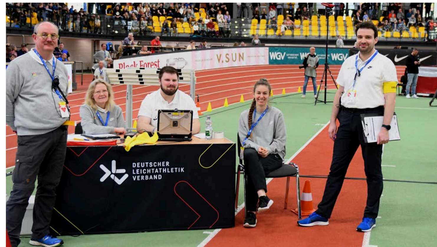
Gut gelaunt trotz stressiger Wochen: die Kampfrichter*innen

Für ihn waren die beiden DM-Termine innerhalb einer Woche nichts Besonderes, für die Kampfrichterinnen und Kampfrichter schon. „Diese Veranstaltungen hat der Weltverband als Test für die FISU World University Games ausgerufen“, blickte Bernhard Bußmann auf das Multisport-Event, das vom 16. bis zum 27. Juli mit über 8.500 Aktiven sowie Offiziellen aus 150 Nationen im Rhein-Ruhr-Gebiet ausgerichtet wird, „die Leichtathletik-Wettbewerbe werden dann im neuen Wattenscheider Lohrheide-Stadion stattfinden.“ Wer „kampfrichtern“ will, benötigt unbedingt das Bronze-Level vom Leichtathletik-Weltverband World Athletics (WA). „Du brauchst als Kampfrichter gewisse Erfahrung, du musst an Fortbildungslehrgängen und Prüfungen teilnehmen. Da wird halt mehr verlangt als auf regionaler Ebene“, fügte Bußmann hinzu, „der DLV achtet