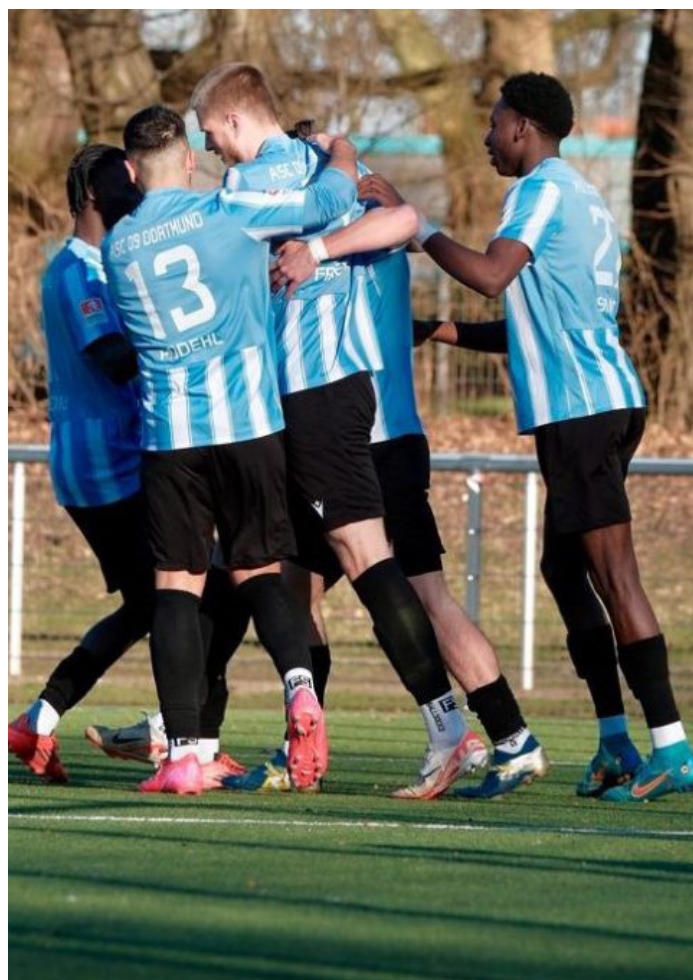
Die 09er starten mit einem Heimspiel-Dreier ins Jahr 2025

Der ASC 09 Dortmund ist ein Verein, der ambitionierten Fußballern eine gute Perspektive verspricht, ob in der Ober- oder gar in der Regionalliga. Um das Drumherum, etwa wo im Falle des Aufstiegs gespielt werden kann, wird man sich in Aplerbeck rechtzeitig kümmern. ■