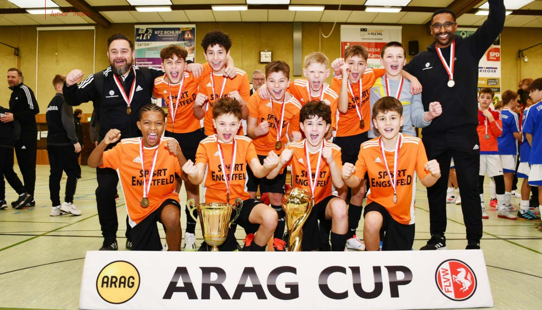
Riesenjubil bei den Siegern aus dem Märkischen Kreis